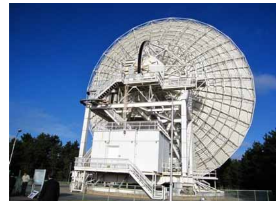
写真②：鹿島宇宙技術センターの34m巨大アンテナ