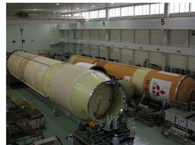
写真②:ロケット艙装組立(三菱重工業株式会社)