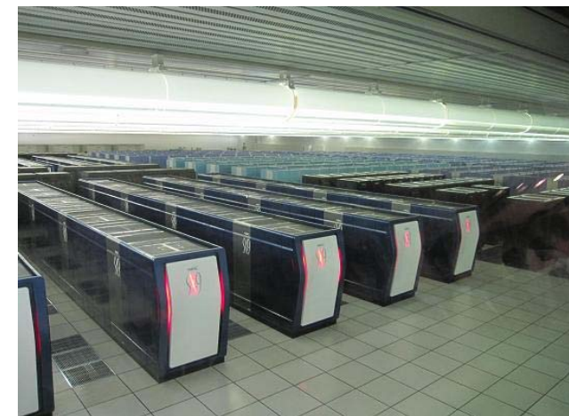
写真①:地球シミュレータ (JAMSTEC 横浜研究所)